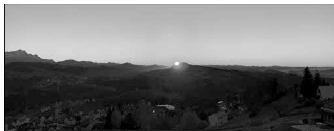
Die schönste Zeit für die schönsten Abendstimmungen,...