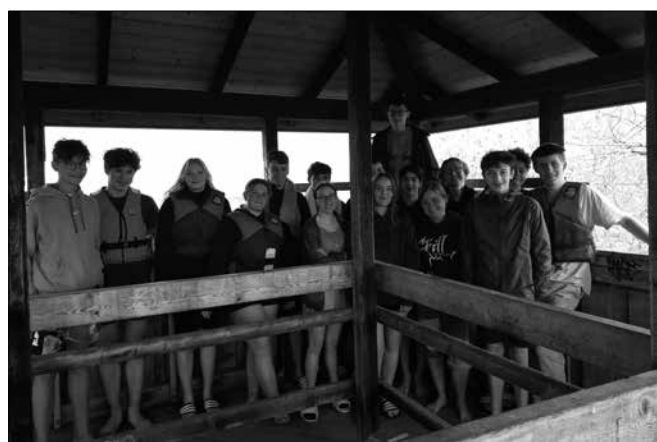
Gemeinsames Konflager mit St. Galler Konfirmand:innen

Am letzten April-Wochenende brachen die Konfirmanden nocheinmal zu einem Ausflug auf. Sie verbrachten zusammen mit den Konfirmanden aus St. Gallen Straubenzell ihr Konflager im Naturfreundehaus Radolfzell am Bodensee. Dort gab es viel Zeit zum Spielen, Paddeln und natürlich auch Zeit, um sich auf die Konfirmation vorzubereiten. Am 22. Mai durften dann sieben Jugendliche aus Rehetobel ihre Konfirmation feiern. Wir gratulieren ganz herzlich und wünschen Segen und Glück für euer Leben.