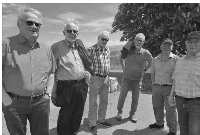
Zufriedene Männerrunde nach dem Zmittag auf dem Nollen.

der Frauenverein den von vielen herbeigesehnten Ausflug dieses Jahr wieder anbieten. Und das mit dem Wetter und den Engeln usw., das lassen wir hier mal so stehen. Auf Kantons- und Nebenstrassen ging die Fahrt über St. Gallen-Gossau-Zuzwil-Wuppenau zum Nollen. Schweizerisch pünktlich erreichten wir genau um 12 Uhr unseren Mittagshalt. Der hohe Lämppegel im Restaurant vor dem Essen war wohl deutliches Zeichen dafür, dass man sich freute, endlich wieder unbeschwert beisammen sein zu können. Und es gab ganz offensichtlich viel zu erzählen und zu fragen. Als das Essen serviert wurde, senkte sich die Lautstärke aber schnell und deutlich.