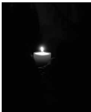
Eine Kerze anzünden für Menschen in der Ukraine.