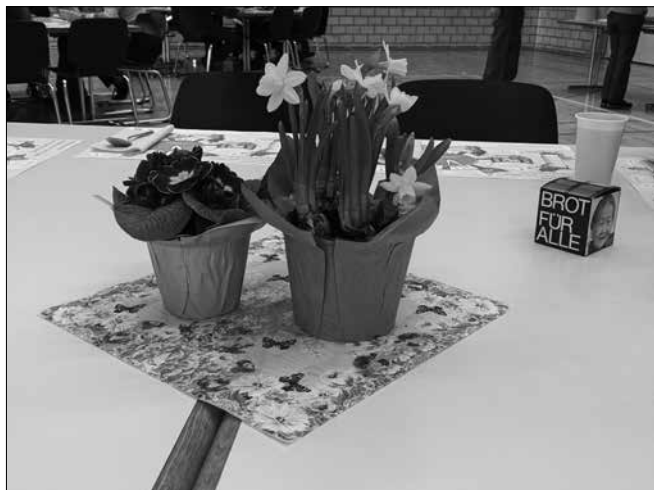
Suppe essen für einen guten Zweck!

Am 13. März feierten wir einen ökumenischen Familiengottesdienst mit Schülern der 6. Klasse zum Thema des diesjährigen Suppentags: Aufmerksam sein für die kleinen Anfänge, die zu etwas GROSSEM führen können. In diesem Jahr wurde unser Blick besonders auf den Klimawandel in den Ländern des Südens gerichtet, die besonders mit den Folgen der Erderwärmung kämpfen. Beim gemeinsamen Suppe essen und der Kollekte im Gottesdienst erzielten wir eine Summe von rund CHF 730.-, die einem landwirtschaftlichen Aufbauprojekt in Guatemala zugute kommt. Herzlichen Dank all jenen, die beim Suppentag mitgeholfen haben. Ein besonderer Dank geht an Nicole Frei für ihre köstliche Suppe.